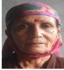
श्रीमती भगवती सदस्य