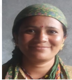
श्रीमति चन्देश सदस्य